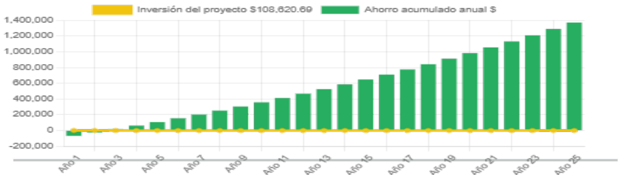
Ahorro económico acumulado a 25 años