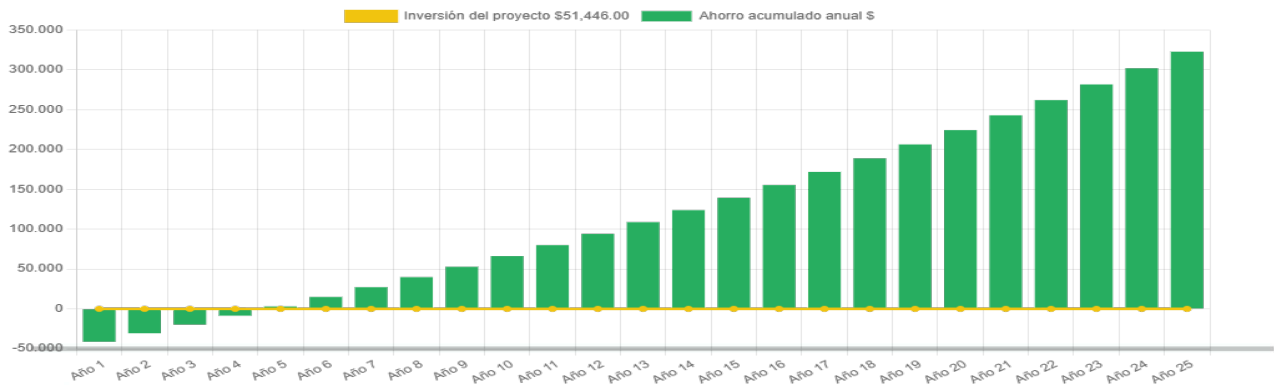
Ahorro económico acumulado a 25 años