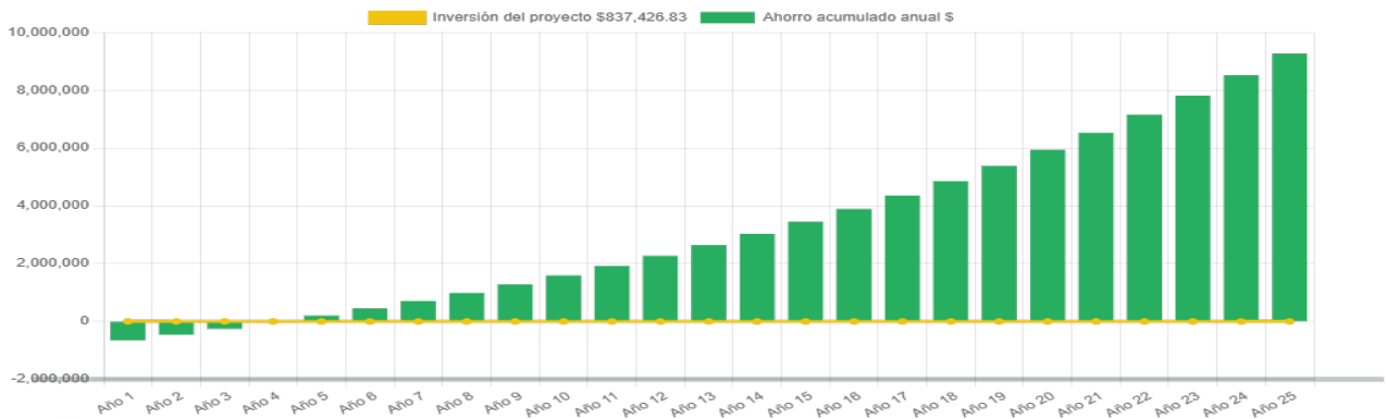
Ahorro económico acumulado a 25 años