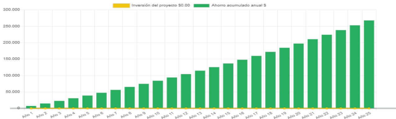
Ahorro económico acumulado a 25 años