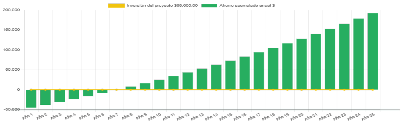
Ahorro económico acumulado a 25 años