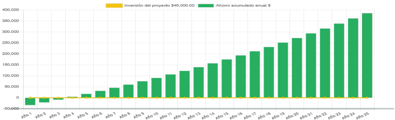
Ahorro económico acumulado a 25 años