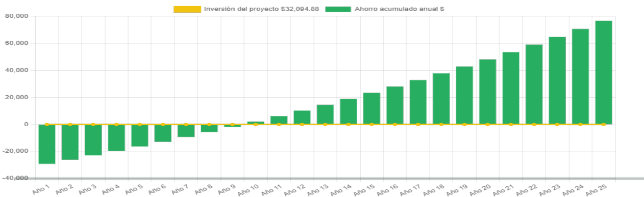
Ahorro económico acumulado a 25 años