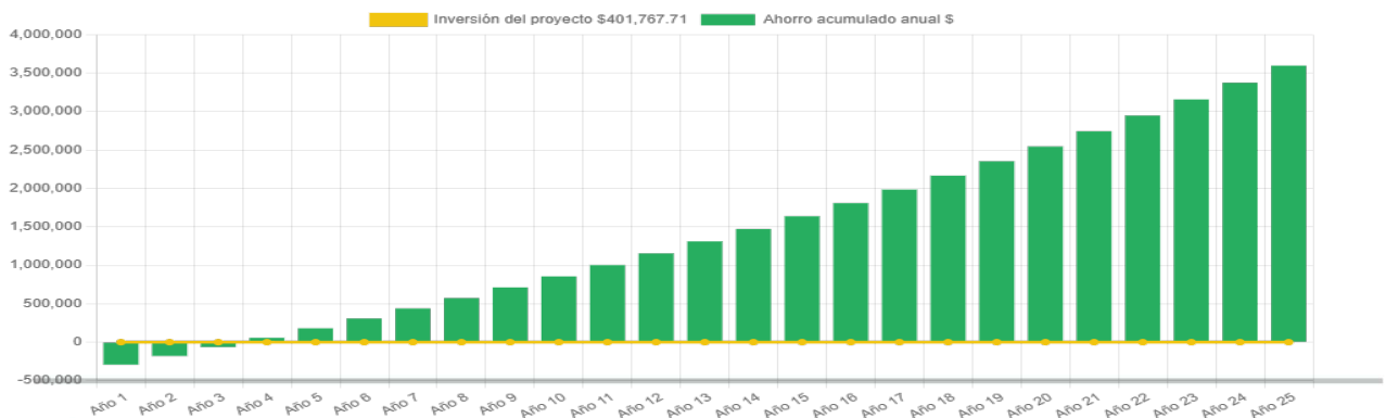
Ahorro económico acumulado a 25 años