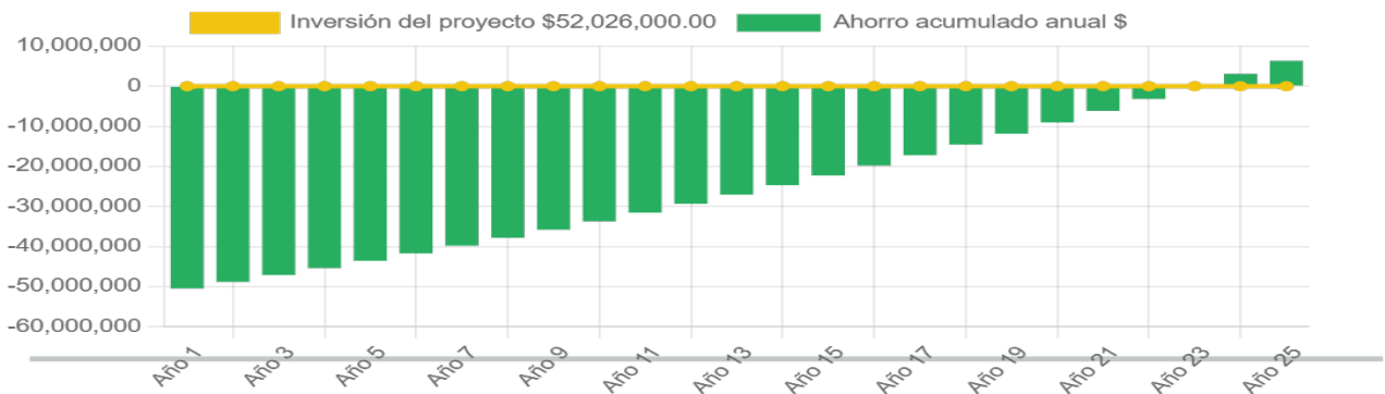
Ahorro económico acumulado a 25 años