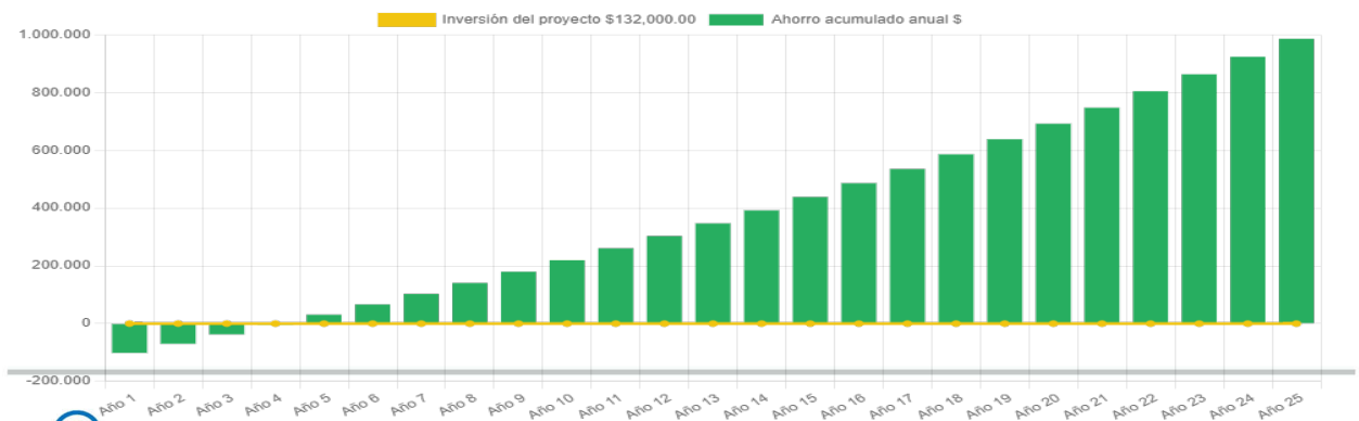
Ahorro económico acumulado a 25 años