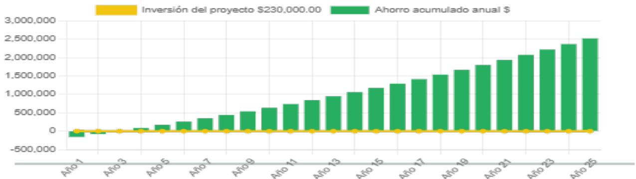
Ahorro económico acumulado a 25 años