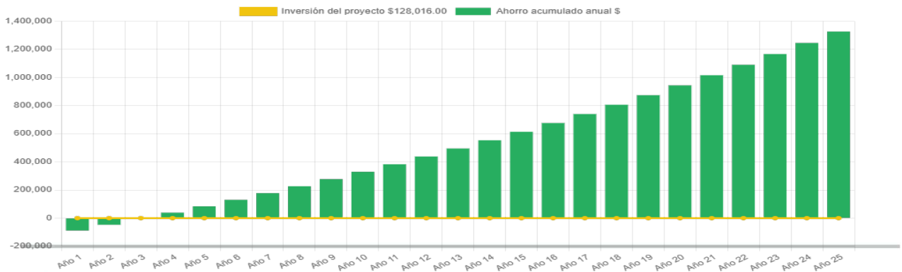
Ahorro económico acumulado a 25 años