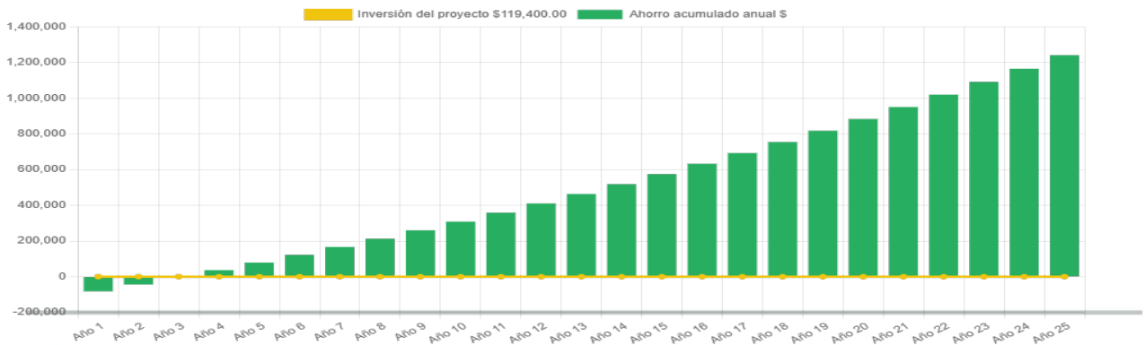
Ahorro económico acumulado a 25 años